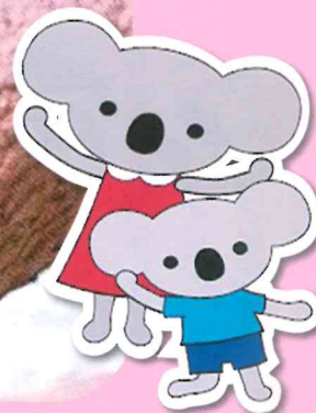
『だいちゃん』 イングランドの丘 (南あわじ市)