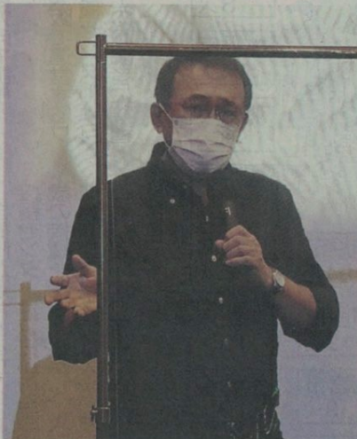
舞台あいさつで、コロナ感染防止の透明板越しに話す長尾和宏医師＝洲本オリオン

上映中の作品は、長尾医師の著作を原作とした「痛くない死に方」と、長尾医師の診察風景などを撮影したドキュメンタリー「けったいな町医者」。 「痛くない」は、在宅医療に従事する医者・河田仁が、末期の肺がん患者を苦しめ続けたまま逝かせてしまった後悔から、在宅医師のあるべき姿を模索し始める物語だ。 「けったいな」は、映画監督らが2019年10月から2020年1月まで約3カ月の