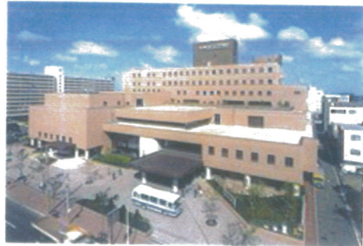
札幌サンブラザ外観