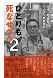
ひとりも 死なせへん②

本日はご参加くださり、誠にありがとうございます。 新型コロナウイルス感染予防のため、常時マスク着用でご参加くださいますようお願い申し上げます。会場入室にあたり、手指消毒にご協力くださいませ。