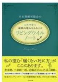
リビングウイルノート