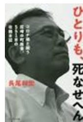
ひとりも 死なせへん①