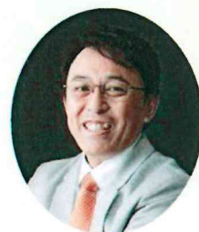
講師プロフィール

東京医大卒業後、大阪大第二内科入局。平成7年、 尼崎市で「長尾クリニック」を開業。外来診療 から在宅医療まで“人を診る”総合診療を目指す。 「平穏死・10の条件」、「葉のやめどき」、「痛く ない死に方」はいずれもベストセラー、最新刊「男 の孤独死」、「痛い在宅医」は発売即重版、他著 書多数。医学書「スーパー総合医叢書」全10巻 の総編集など。日本慢性期医療協会 理事、日本 尊厳死協会 副理事長、日本ホスピス在宅ケア研 究会 理事、関西国際大学 客員教授。医学博士。