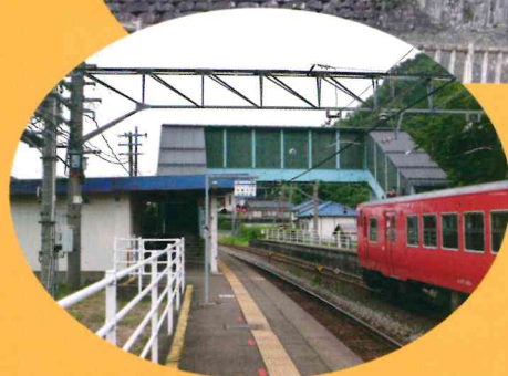
山陰本線 玄武洞駅