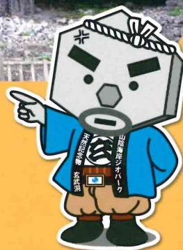
ゆるキャラ 玄さん