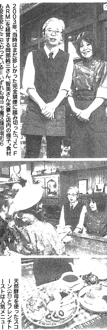
■禁煙の取り組み紹介■ カフェ「JC FARM」(神戸市灘区)

1994年のオープン時は喫煙可だったものの、「せつつかの香や味わいいをたばこの煙なしに楽しんでもいい」と2003年に完全禁煙に踏み切った。当初は禁煙と聞いて怒って出向く客も少なかったが、「エタを禁煙にしてきたと歓迎する声に後押しされた。当時はまだ珍しかった完