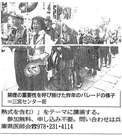
禁煙の重要性を呼び掛けた昨年のパレードの様子(三宮センター街)

県民フォーラム 神戸で開催 6月1日 兵庫県医師会館 『2019年世界禁煙ウィーク兵庫県民フォーラム』が6月1日、神戸市中央区の兵庫県医師会館で開かれる。今年テーマは「禁煙防止条例改正をふまえて」。