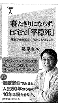
「寝たきりにならず、自宅で平穏死」(SB新書)

日本慢性期医療協会の武久洋三会長は、こうした慢性期リハビリに関する興味深い提案をしている。24時間リハビリとPTの派遣システムである。PTという限られた人的資源を、地域の中で「派遣」という形で医療機関同士でシェアすべきではないか。都市部では自動車はシェアという時代である。派遣でシェアする