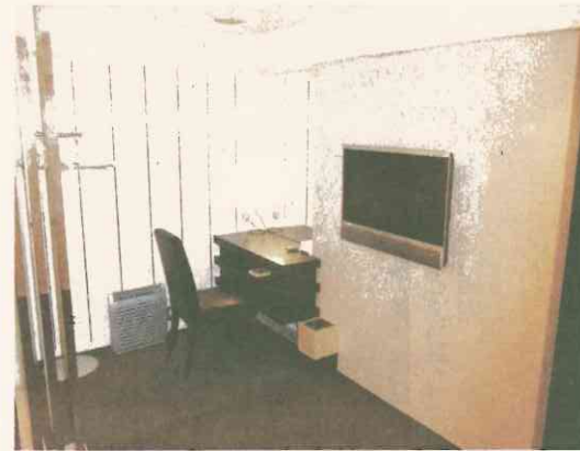
「ご安置ホテル リレーション」にある家族用の控室—大阪市北区

したときの感覚も再現する。 高度なカメラやセンサーを駆使し、他社のゲーム機とは一線を画す。だが、スイッチの前々機種「Wii (ウィー)」からのアイデアで新鮮味に乏しいのも事実だ。(大島直之)