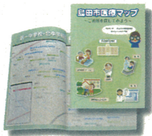
島田市医療マップ

同時に「島田市医療マップ」を2,500冊作成しました。お住まいの地域の医療機関や薬局などを知っていただくよう、中学校区単位で医療機関などの所在地・電話番号・診療日・診療時間などの基本的な情報が掲載されています。ぜひ、ご活用ください。