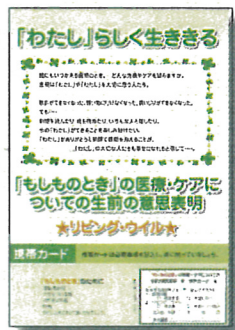
リビング・ウイル島田版冊子

リビング・ウイルとは「もしものとき」の医療について、あなたの意思を表明しておくことです。「もしものとき」とは、人工呼吸器なしで呼吸ができなくなったり、飲んだり食べたりできなくなったり、できる限りの治療をしても、回復する見込みがなくなったときのことをいいます。リビング・ウイル島田版は、もしものときに「どんな医療を受けたいのか」あるいは「受けたくないのか」、あなた自身の希望を書き込むことができる冊子です。