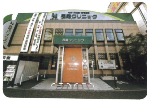
医療法人格和会 長尾クリニック 国兵庫県尼崎市昭和通7丁目242番地 ☎06-6412-9090 http://www.nagaoclinic.or.jp/