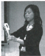
簡単に尿糖値が計れます

電子尿糖計『UG-120』は、採血のない無痛測定で、センサーに尿をかけるだけ。6秒ほどで尿糖値が測定可能。特に、食後高血糖の状態を知ること、生活習慣を改善のきっかけに。糖尿病の発症を未然に防ぐための、有効な支援手法と期待されています。