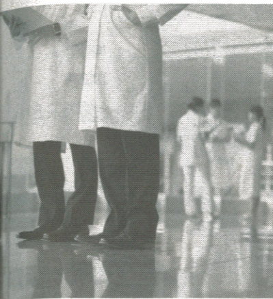
医師は患者を断れない

前出・長尾医師が語る。「金儲けとしか考えられない悪質な免疫療法が横行しているようだ。100万円単位のお金を支払った挙句、症状が改善せず、症状を悪化させてしま